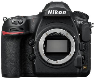
Nikon D850 DSLR Camera Body