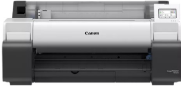
Canon imagePROGRAF TM-250 24" Plotter