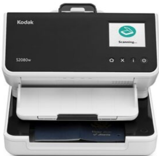
SCANNER KODAK S2080W

La serie S2000 está diseñada para 'acoplarse' sobre el accesorio de Cama Plana para Pasaportes KODAK, que ofrece una solución rápida y sencilla para digitalizar pasaportes, tarjetas de identificación y otros documentos pequeños y frágiles. No tendrá que utilizar otro cable de alimentación ni otro puerto USB en el equipo host. Gracias a la integración optimizada con TWAIN y el controlador ISIS, no resulta necesario utilizar varios controladores para el escáner.